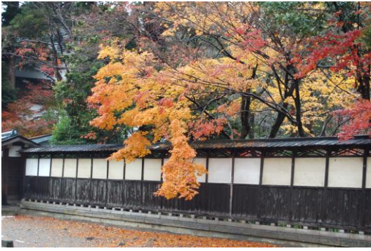
中野邸美術館(新潟市)