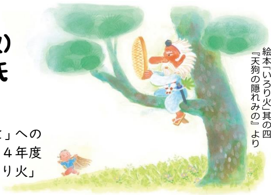
絵本「いろり火」其の四 『天狗の隠れみの』より